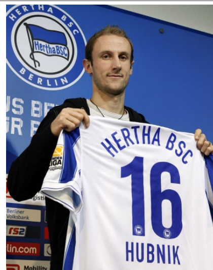
Roman Hubník (06. 06. 1984)

V roce 2002, ve 14 letech, přestoupil do Sigmuy Olomouc, za kterou odehrál 103 ligových zápasů. V roce 2003 reprezentoval na MS hráčů do 20 let, v únoru 2007 odešel do FK Moskva. Od ledna 2009 hostoval ve Spartě. V české lize zářil a v lednu 2010 zamířil do Herthy Berlín. Rychlý a důrazný obránce, výborný hlavičkář, který dobře čte hru. Reprezentant.